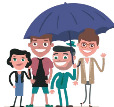
Tabela informacyjna o najistotniejszych warunkach ubezpieczenia